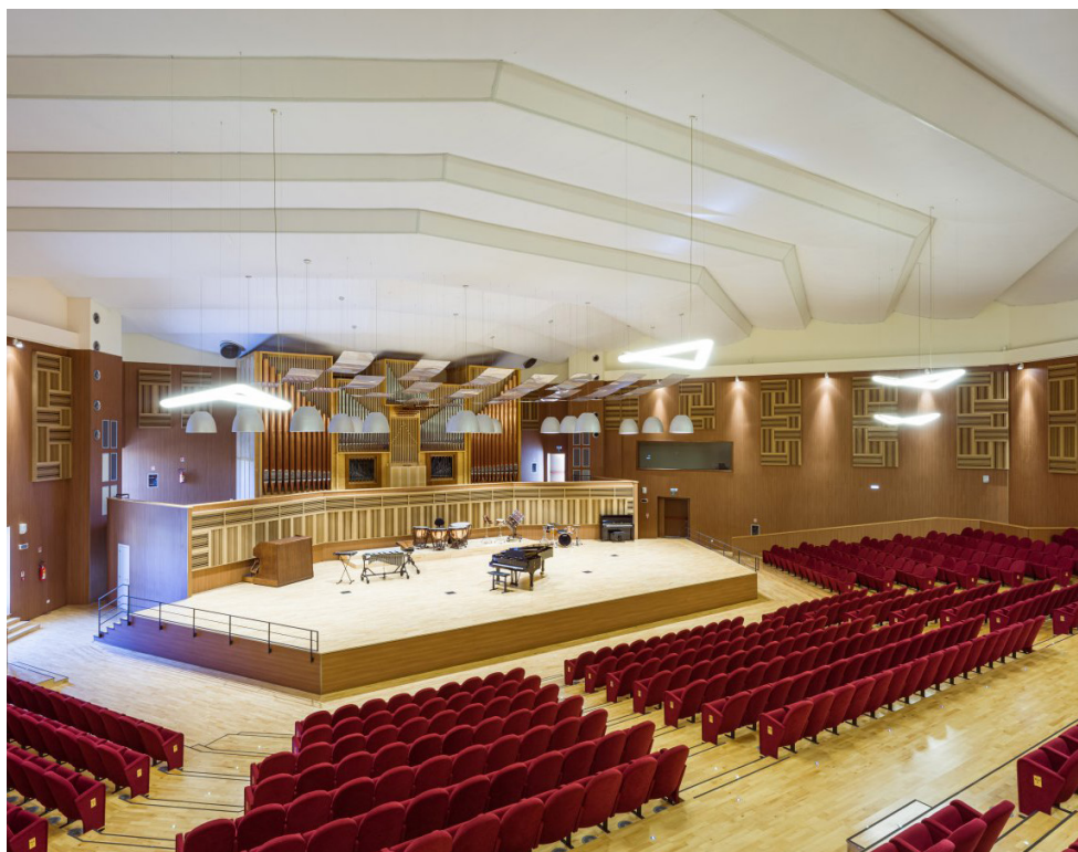
La Sala da Concerto del Conservatorio "N. Piccinni" di Bari Auditorium Nino Rota